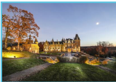
Château de la Poste