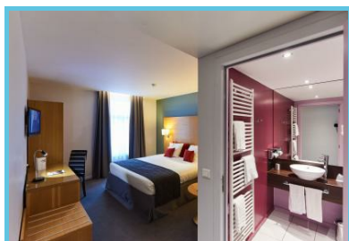
Hôtel de la Couronne