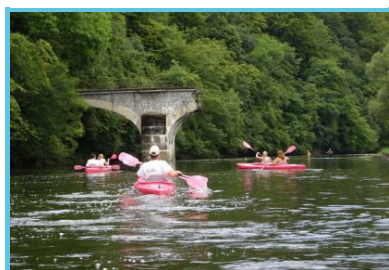
Kayak de la Vanne

Rue Léon Henrard 10 Alle-sur-semois - 5550